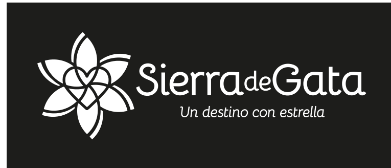
Versión secundaria | Horizontal 01 | Negativo negro