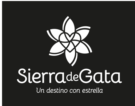
Versión principal | Vertical 01 | Negativo negro