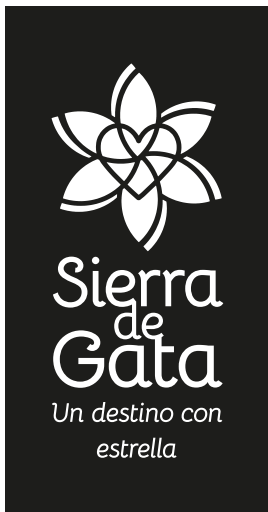
Versión principal | Vertical 02 | Negativo negro